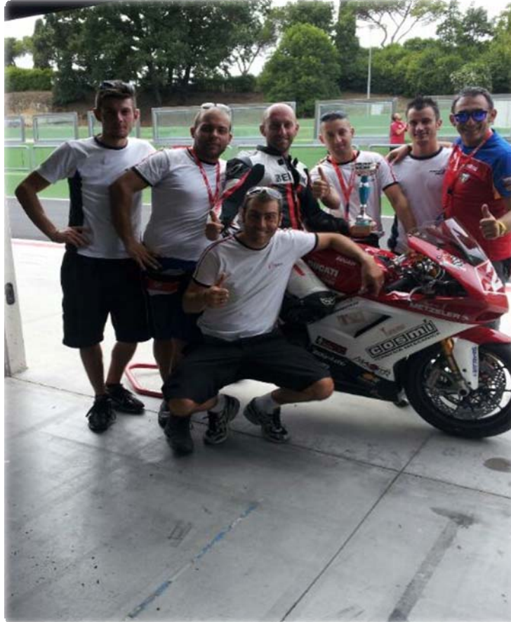
Podio 3° Gara del 06-07-2014, Autodromo del Mugello (FI) .